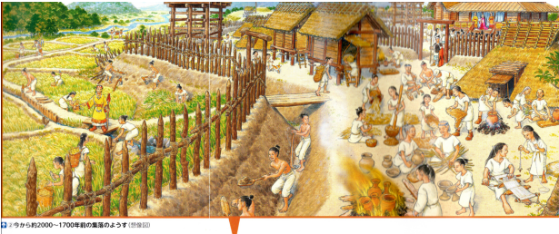
今から約2000〜1700年前の集落のようす (118頁)

◎六十九・七十ページの「今から約二〇〇〇〜一七〇〇年前の集落のようす」を見て、食べ物をすべて書きましよう。教科書に○をつけて、それからノートに書きます。縄文時代の授業でもやっています。想像図を見て、縄文時代と弥生時代を比較し、くらしがどのように変わっているかを「食