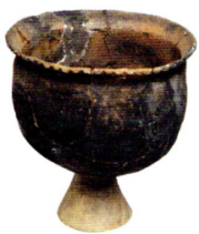
③米のたきに使われた弥生土器