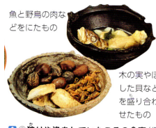
魚と野鳥の肉などをにたもの